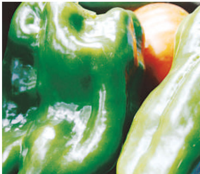
Bien nourris, les poivrons deviendront gros.

Sur des lignes espacées de 60 cm, creusez tous les 40 cm un trou de 20 cm de diamètre et de profondeur, et remplissez-les de terreau de compost. Plantez les poivrons en