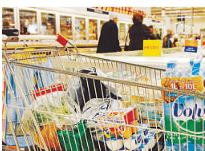
De 2002 à 2008, la proportion de personnes citant le prix comme critère de choix du lieu d'achat des produits alimentaires a presque doublé.

Le facteur prix apparaît particulièrement sensible