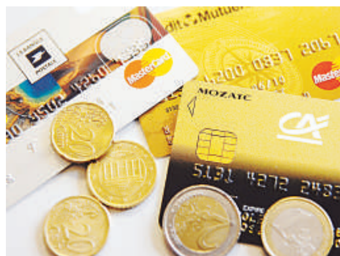
Avec les crédits revolving, l'accès à l'argent paraît très facile.

«Le délais de rétraction après souscription à un crédit